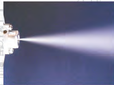
水溶性希釈タイプ吹き付け